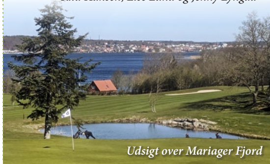
Udsigt over Mariager Fjord